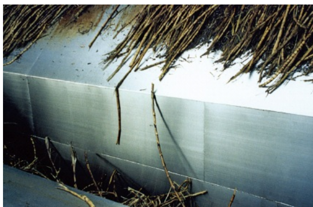
Lateral do condutor de cana-de-açúcar